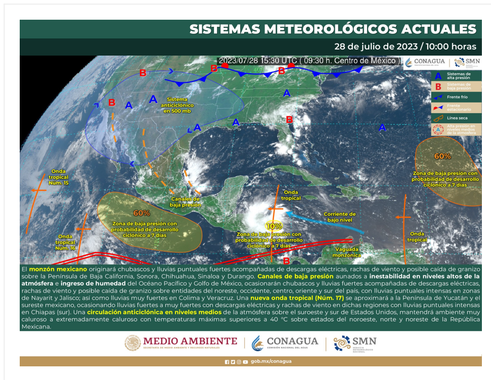
Figura 1. Sistemas meteorológicos que afectan a México.

y puntuales intensas (75 a 150 mm) podrían originar incremento en los niveles de ríos y arroyos, deslaves e inundaciones en zonas bajas de los estados indicados.