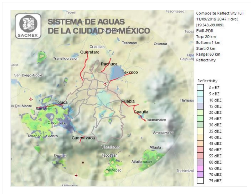
Imagen de Radar

Radar de SACMEX, CDMX., de las 20:47 horas, tiempo del centro de México.