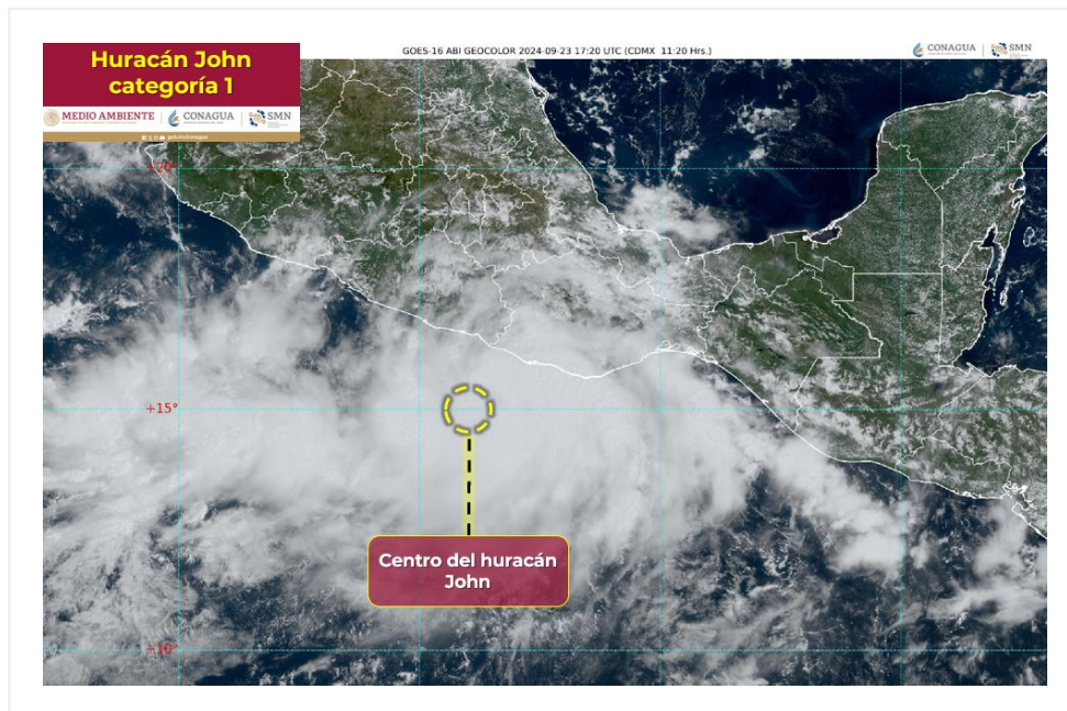
Imagen de satélite

Síntesis: JOHN SE HA INTENSIFICADO A HURACÁN DE CATEGORÍA 1, PRÓXIMO A LAS COSTAS DE OAXACA Y GUERRERO