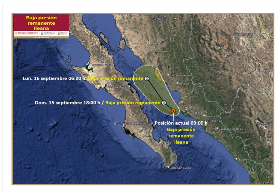
Posición actual de la baja presión remanente Ileana