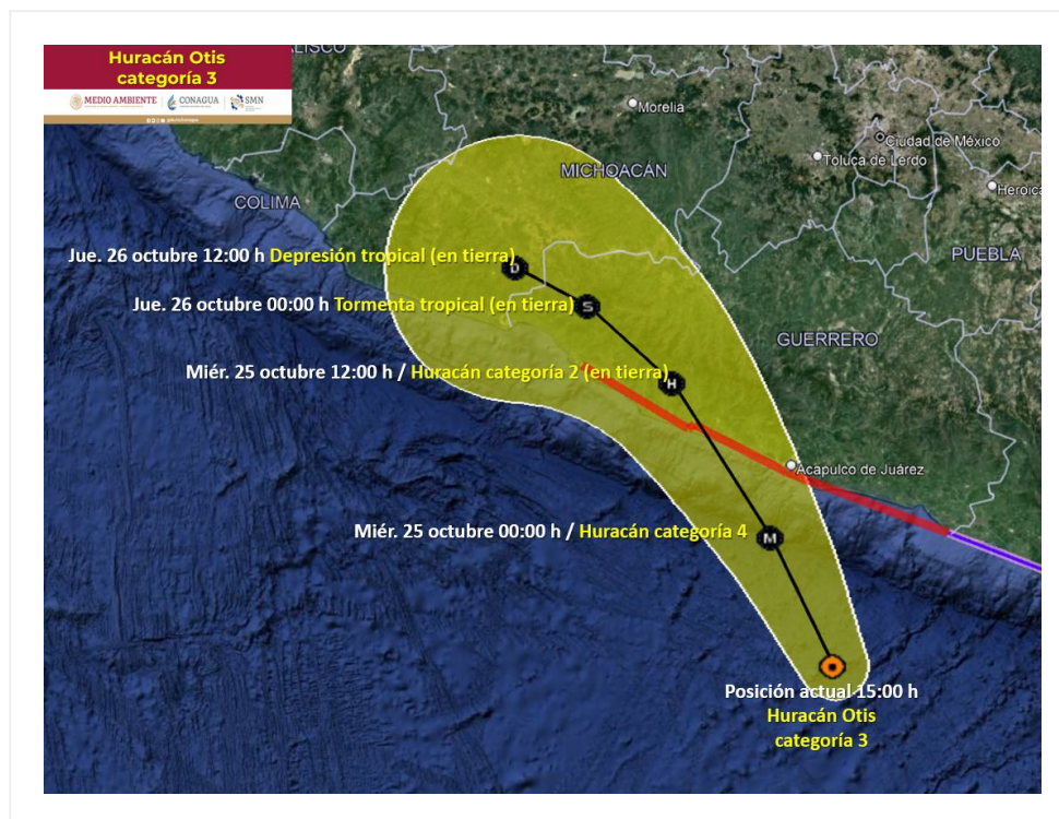
Pronóstico de trayectoria del huracán Otis de categoría 3