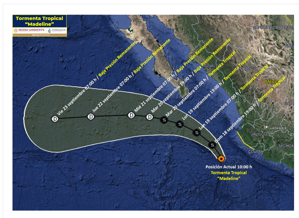
Pronóstico de trayectoria de la Tormenta Tropical "Madeline"