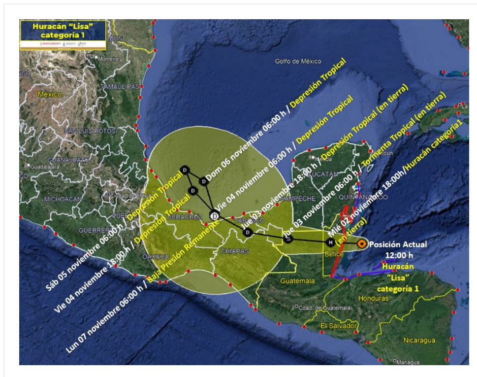
Trayectoria pronóstico del Huracán "Lisa" Categoría 1