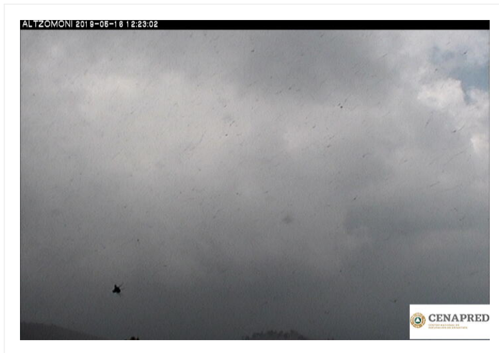
Imagen 1: Volcán Popocatépetl, 12:23 hrs (horario de verano).

SE PRONOSTICA QUE LA CENIZA VOLCÁNICA TENDRÁ UNA TRAYECTORIA CON DIRECCIÓN HACIA EL ESTE DE LA REPÚBLICA MEXICANA