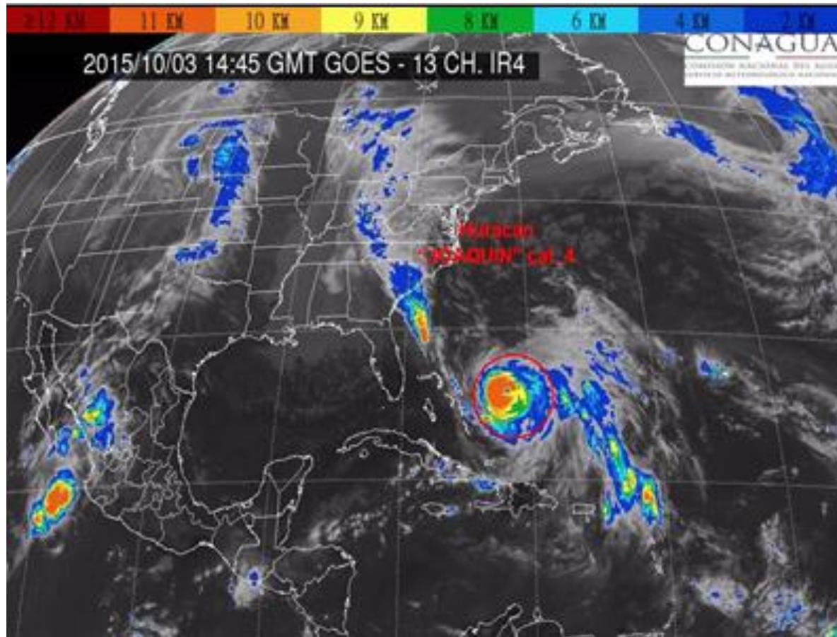
Imagen de satélite canal infrarrojo con el huracán "Joaquin" del Océano Atlántico. CNA-CGSMN - GOES-13 IR Octubre 03 a las 10:15 horas