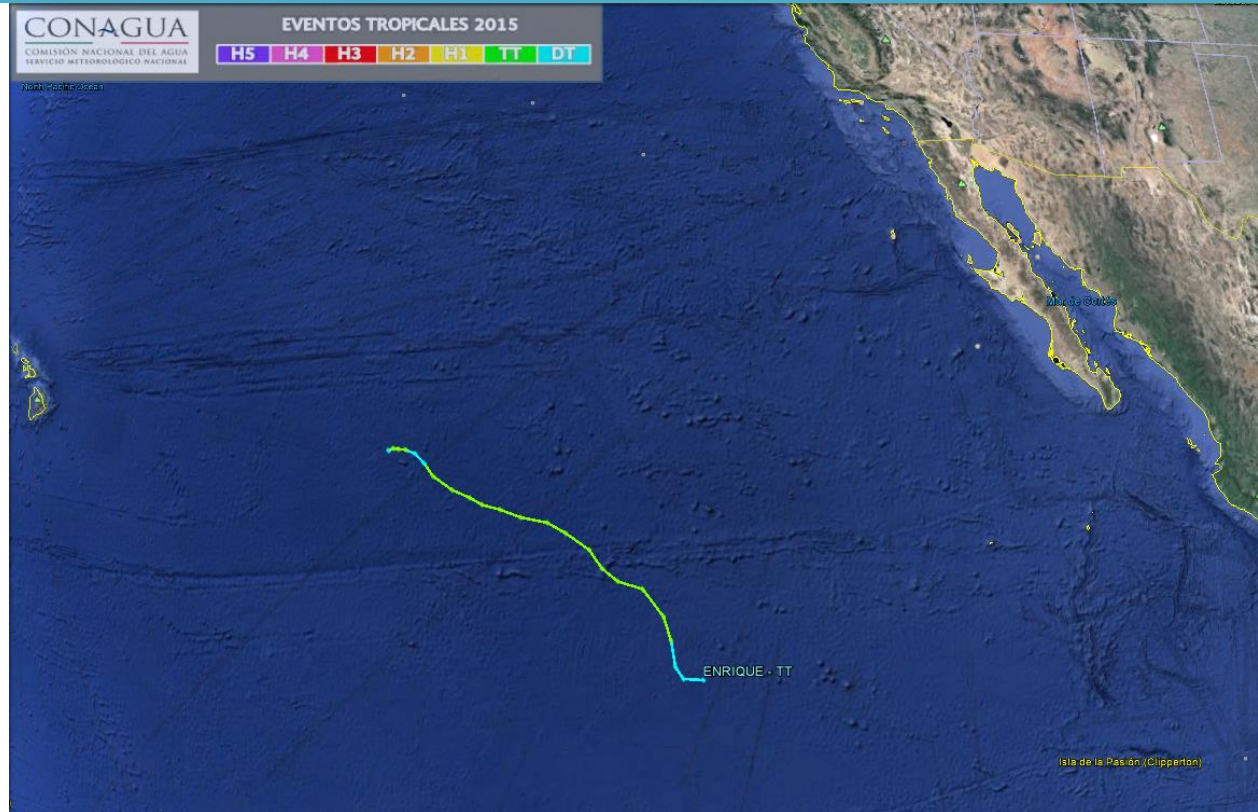
Trayectoria final de la tormenta tropical "Enrique" del Océano Pacífico